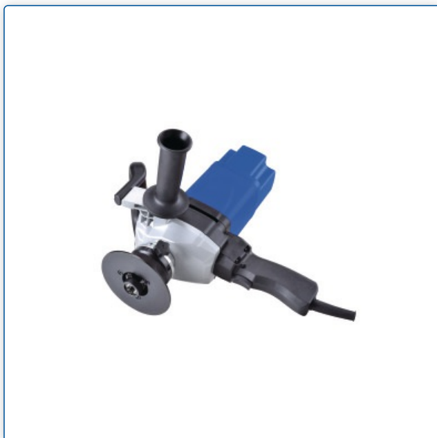
KE 6-2 z zamontowanym uchwytem bocznym