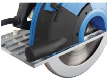
Zintegrowana komora odchylenia wiórów