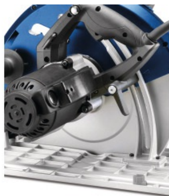
Regulacja głębokości cięcia z tyłu