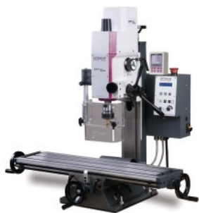
Rys.: MH 20VL