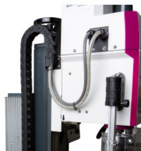
Łańcuch energetyczny Łańcuch energetyczny