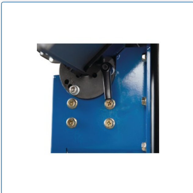
Z płynną regulacją kąta i punktami blokady do 15°, 30° i 45°