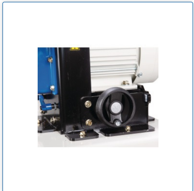
Bezstopniowa regulacja głębokości ukosowania bez użycia narzędzi