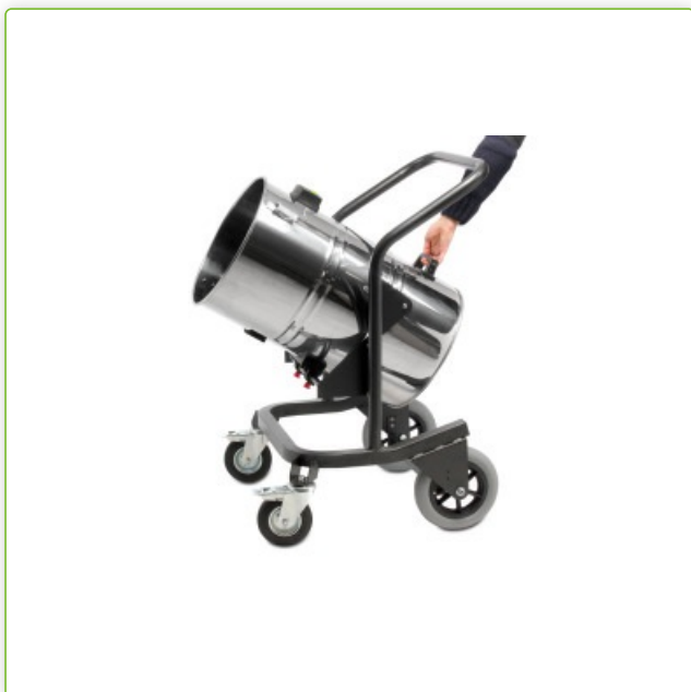
Urządzenie przechylne ułatwiające opróżnianie zbiornika