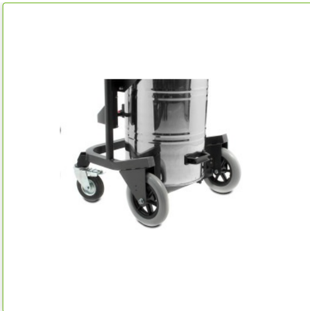
Stabilne podwozie z dużymi gumowymi kołami i kółkami skrętnymi