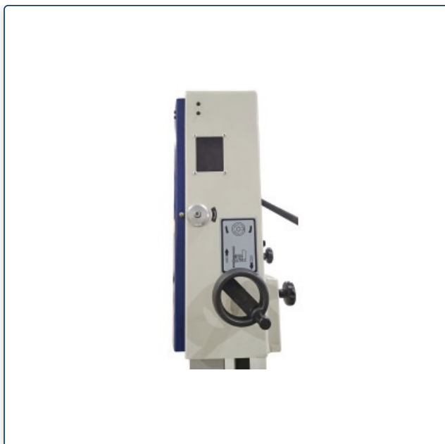
Regulacja wysokości cięcia