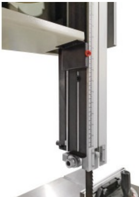
Regulacja wysokości cięcia