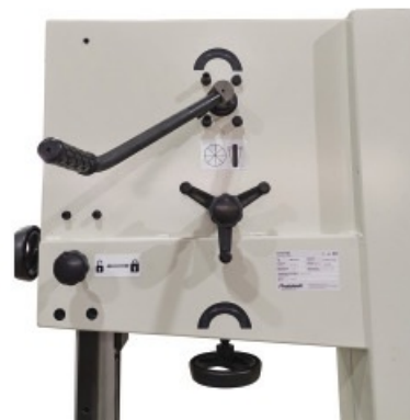
System szybkiego napinania