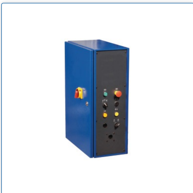
Przejrzysty panel sterowania