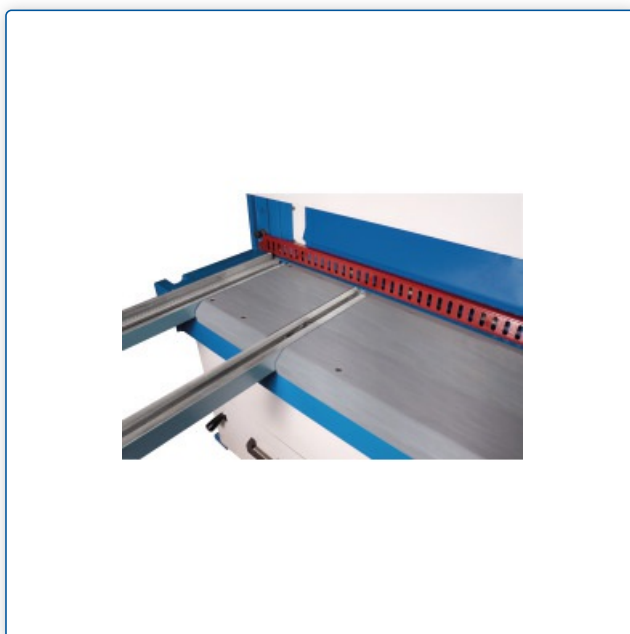
Stół roboczy z masywnymi ramionami podporowymi