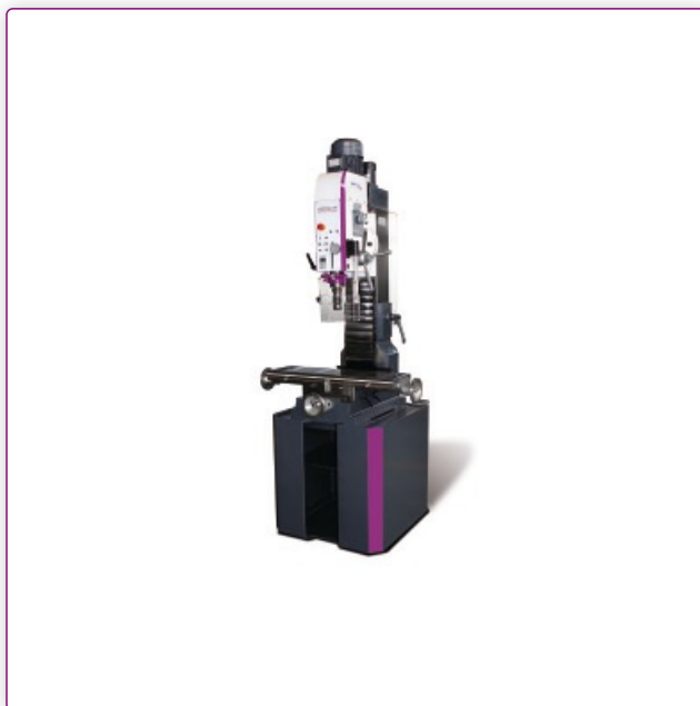
Zdjęcie przedstawia podstawę stalową z akcesoriami, nr art. 3353015